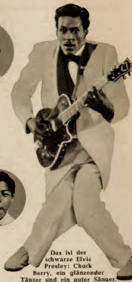
Das ist der schwarze Elvis Presley: Chuck Berry, ein glänzender Tänzer und ein guter Sänger.